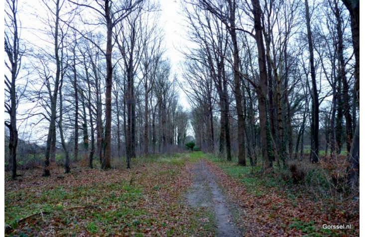
Landgoed Klein Zwabink aan de Valkeweg (linksboven) en uitzicht vanaf deze weg bij hoog water. Rechtsonder: Het pad over het voormalige trambaantracé, iets voorbij Intermetzo.