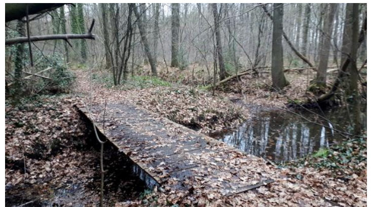
Bruggetje over Flierderbeek bij punt 18