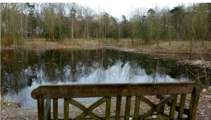
Vennetje met bankje bij punt 15