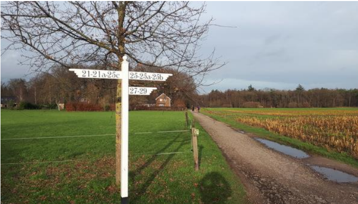
Richtingwijzer bij punt 5