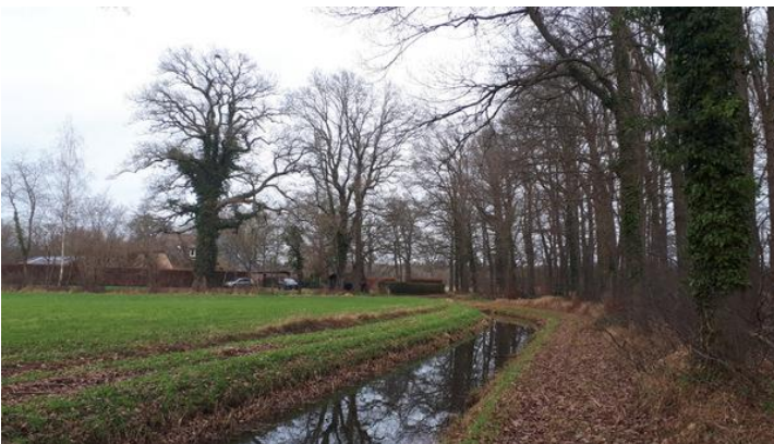
Langs de beek richting Flierderweg bij punt 11