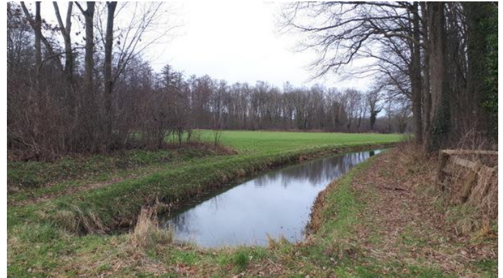
Flierderbeek met onderin de dam van punt 10